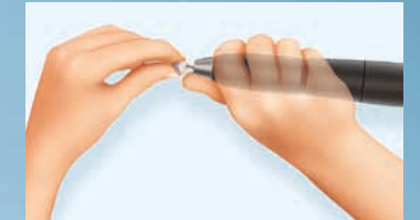
K-ERGOgrip (oben): Ergonomisches Halten, schonend für das Handgelenk. Kein „Abknicken“ des Handgelenks wie bei anderen Handstücken (Beispiel unten)