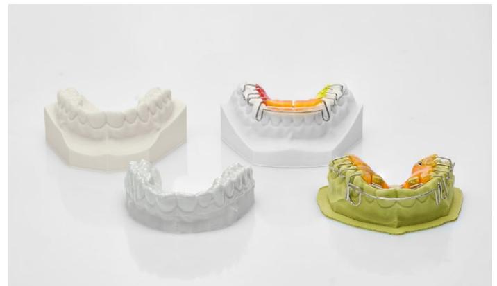
Ausgelegt für die gesamte Modellherstellung im KFO-Bereich